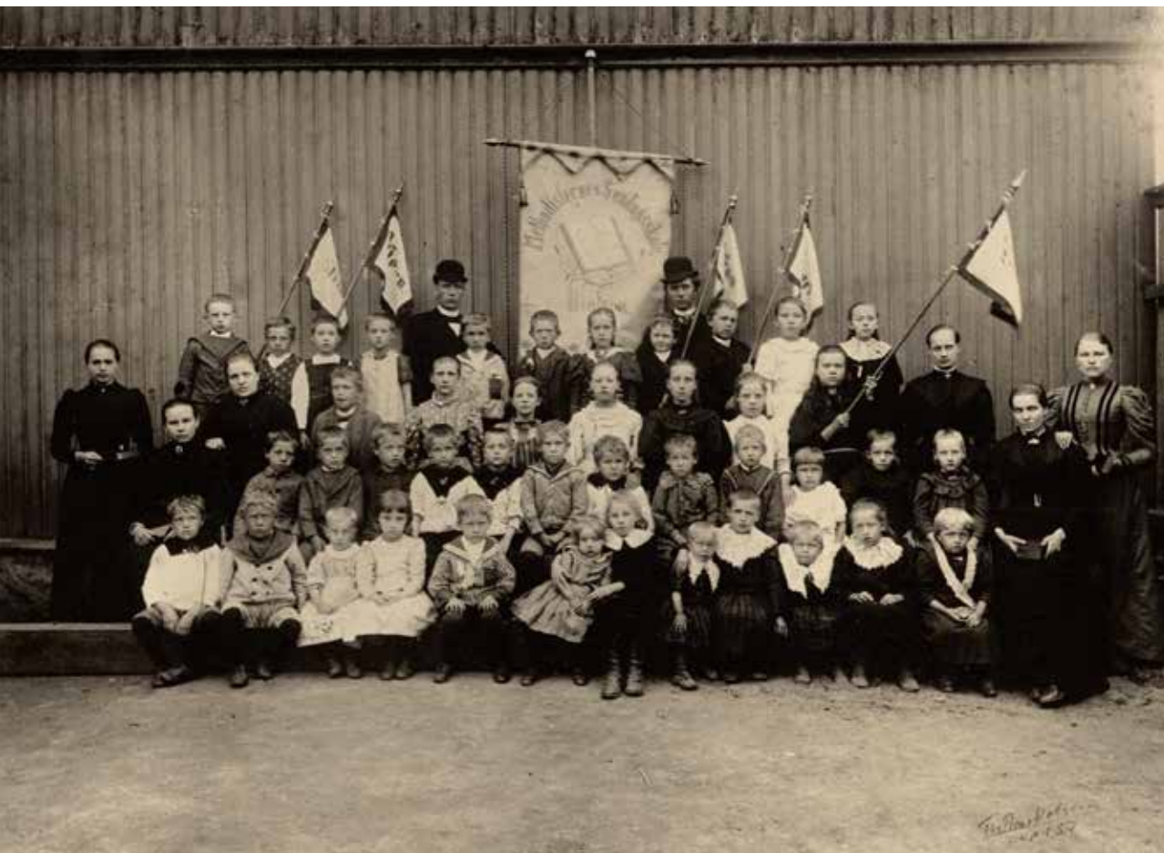
Søndagsskolen 1889.

og Sarpsborggaten, drøye 100 meter fra Smieloftet. I 1896 ble den nye trekirken, som fikk navnet Immanuelkirken (fra hebraisk «Gud med oss»), innviet.