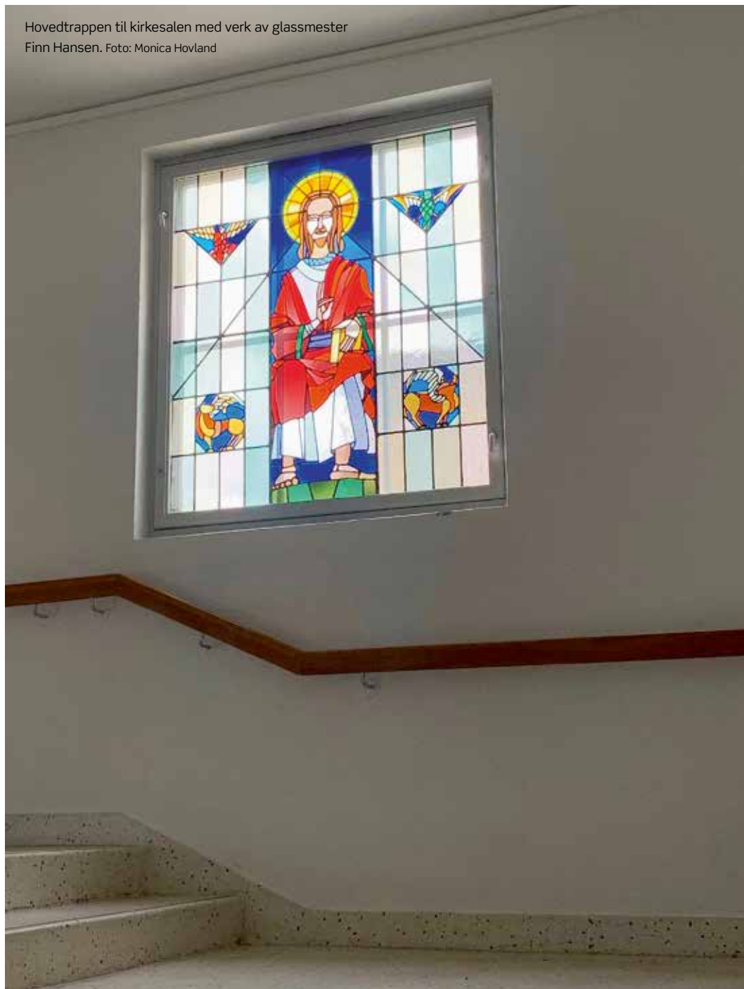
Hovedtrappen til kirkesalen med verk av glassmester Finn Hansen.

Kirken som lokalt etterhvert er blitt kalt for «kjerka på hjørnet» 5 , er karakterisert med nettopp en hjørnefasade formet som et kirketårn, med et inngangsparti nederst i tårnet og avsluttet med et tak-kors. Det skal få oss til å løfte blikket oppover! Langs fasaden mot Sarpsborggata er det i alt sju avlange kirkevinduer som forteller at det innenfor, i 2.etasje, er et kirkerom.